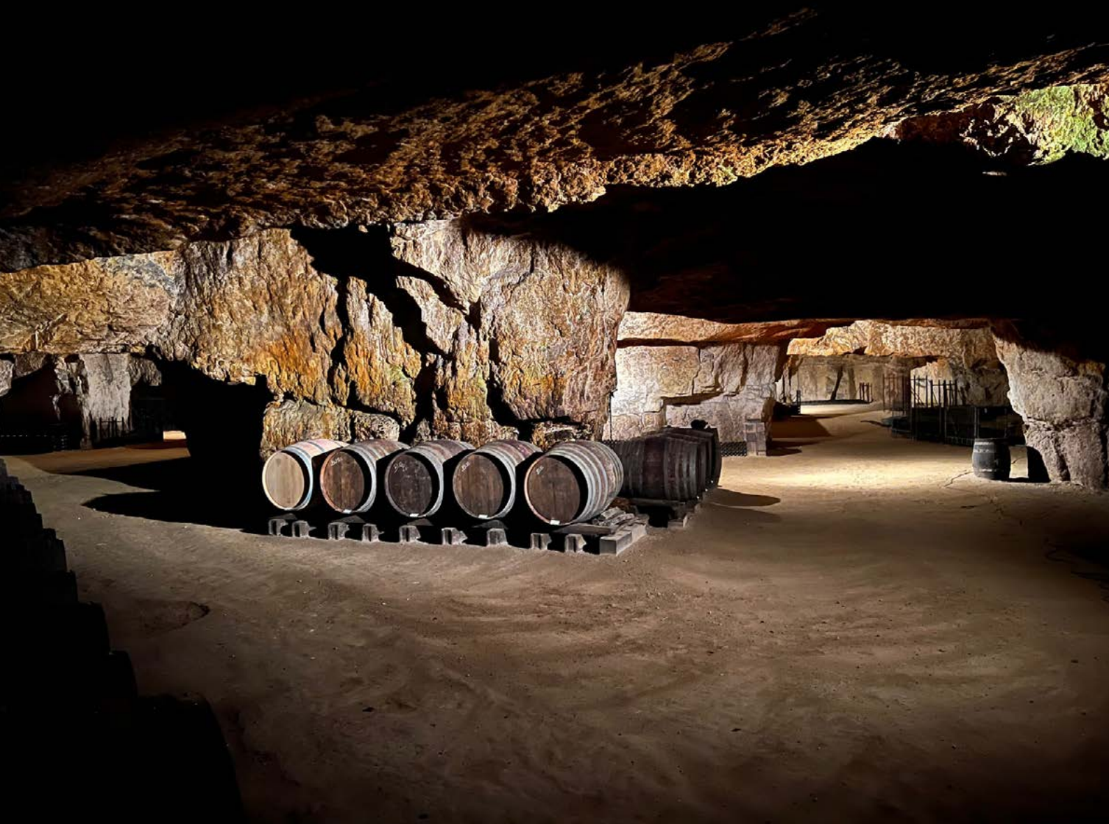
Fad og lagringskælder